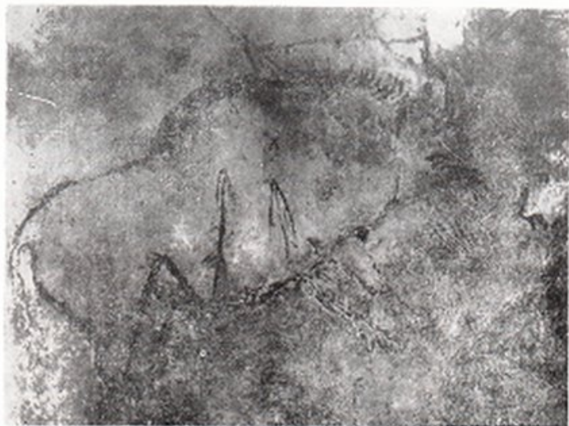
Resim 3- Ollarla yaratılmış bizon, Niaux (Ariège) mağarası