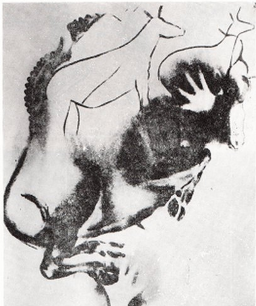
Resim 4- Bizon ve diğer hayvanlar üzerinde el silüetleri. Ovinyüneyen, Castillo (Santander) mağarası