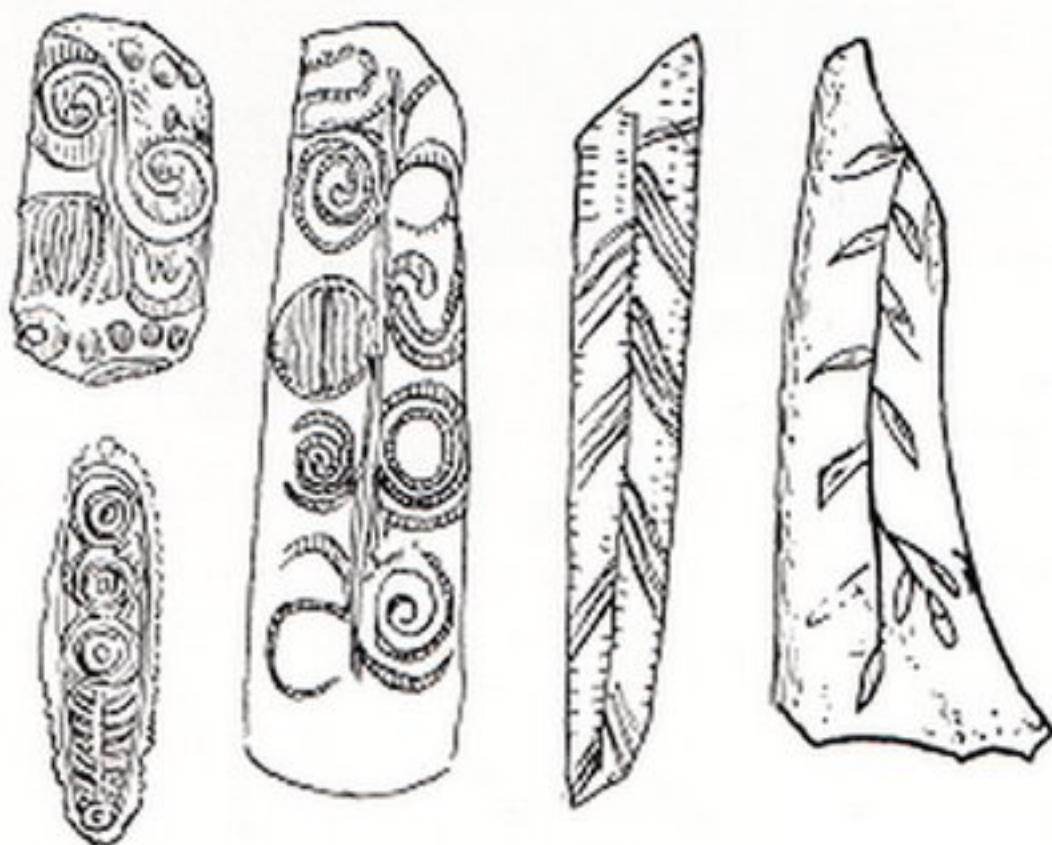
Resim 2- Bitki motifleri ve çizgili bezekler