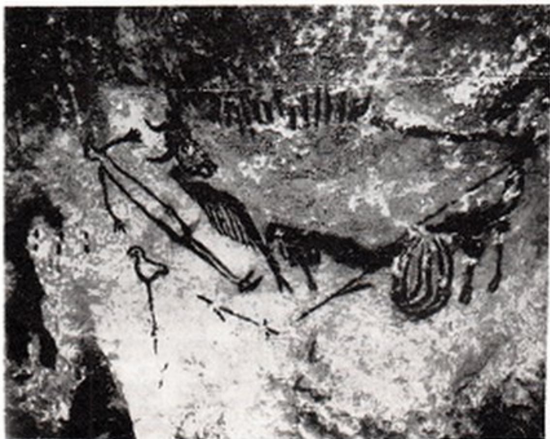
Resim 6- Kuyu Sahnisi. Lascaux (Dordogne) mağarası