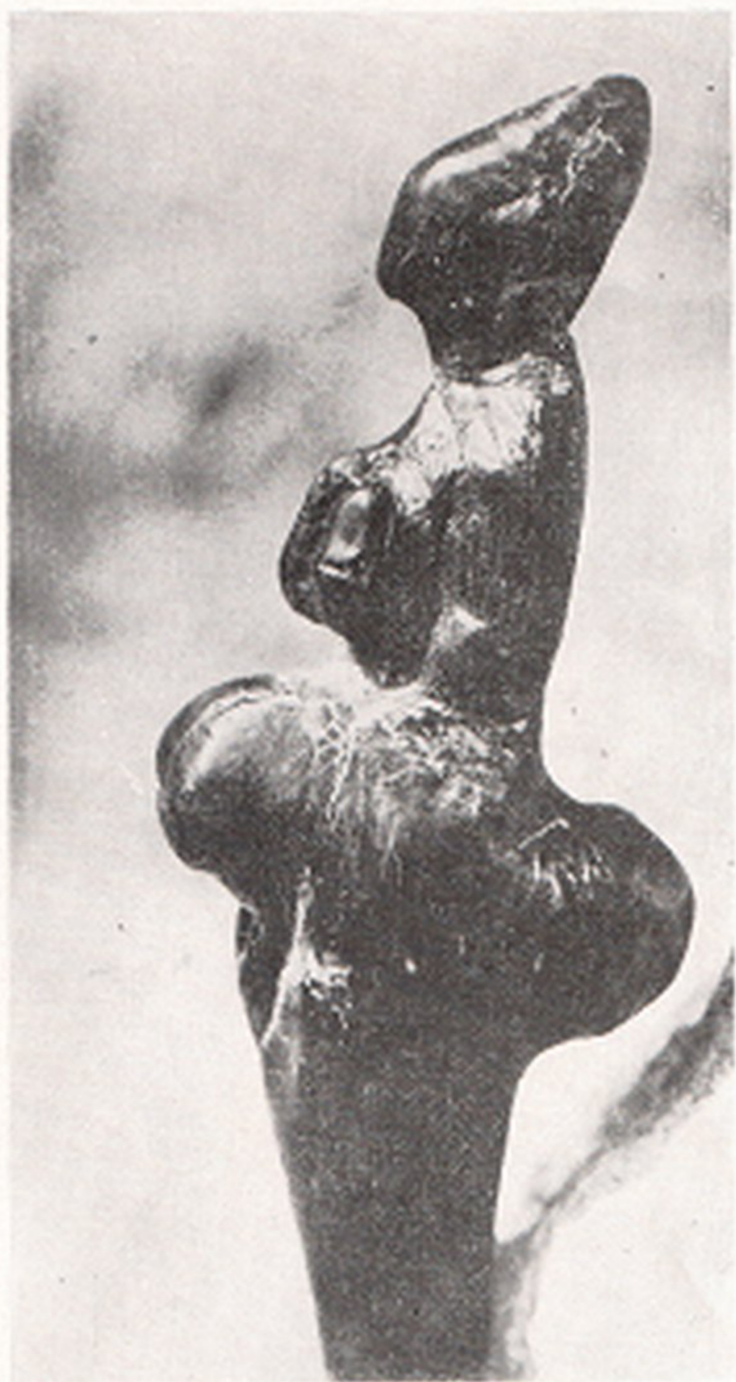
Res. 10- Orinyasiyen kadın heykeli (taşta), "Le Polichinelle" Boy. 62 mm. Brasseur-Roussé (Grimaldi, Ligurie, İtalya)