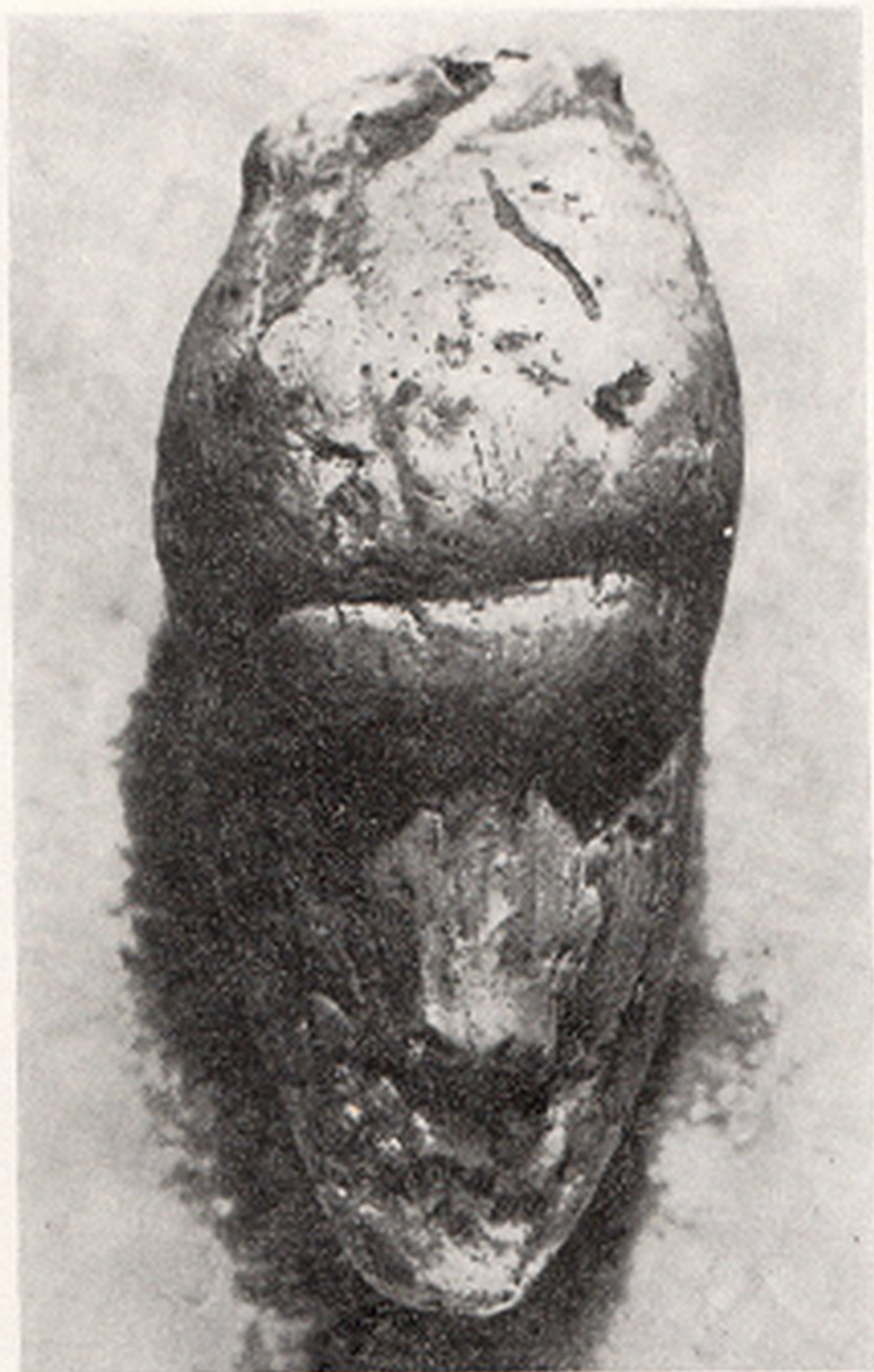
Res. 3- Fildişi kadın başı figürünü Dolní Věstonice (Moravya - Çekoslovakya)