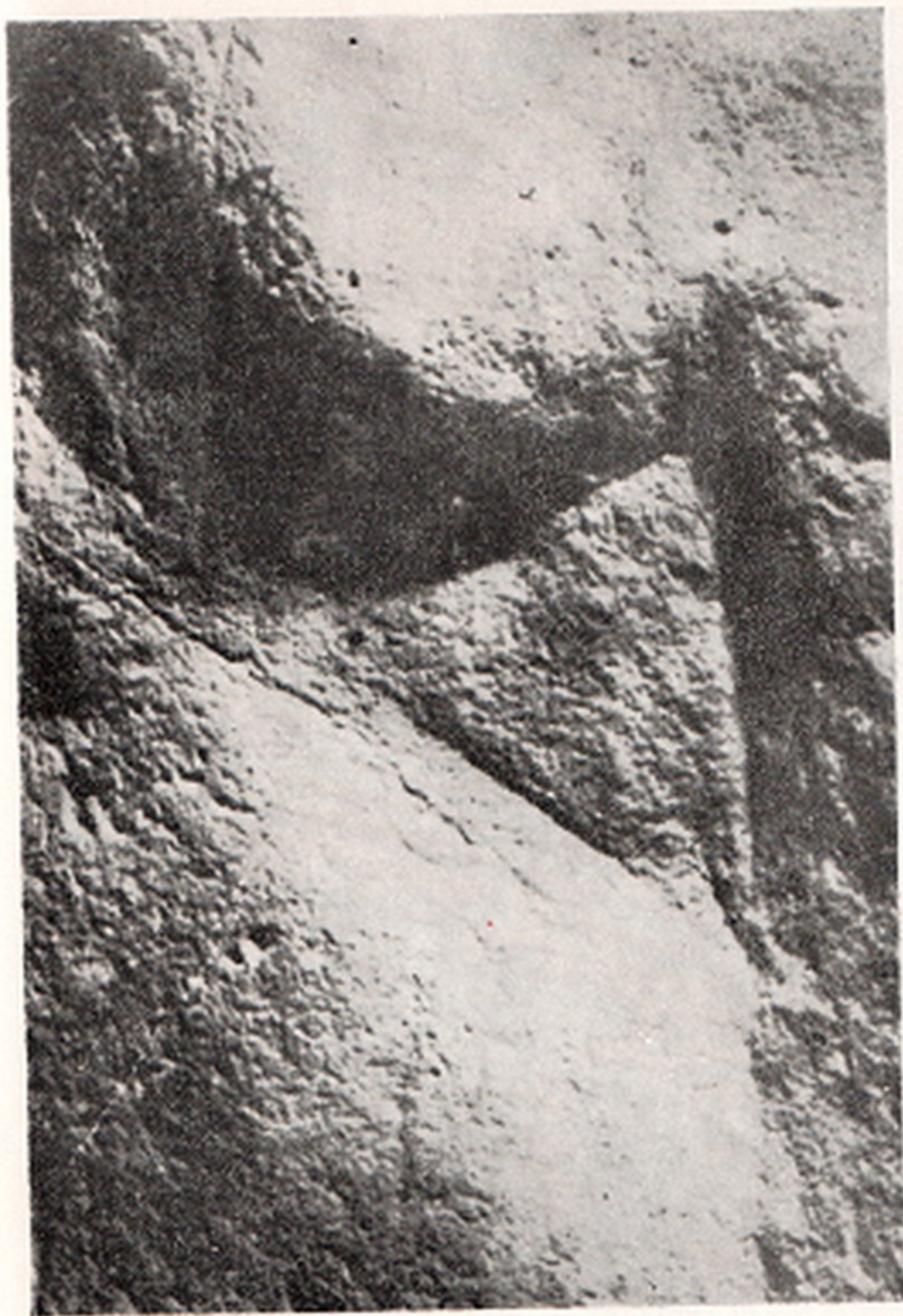
Res. 12- Kadın gravürü. La Madeleine (Fransa)