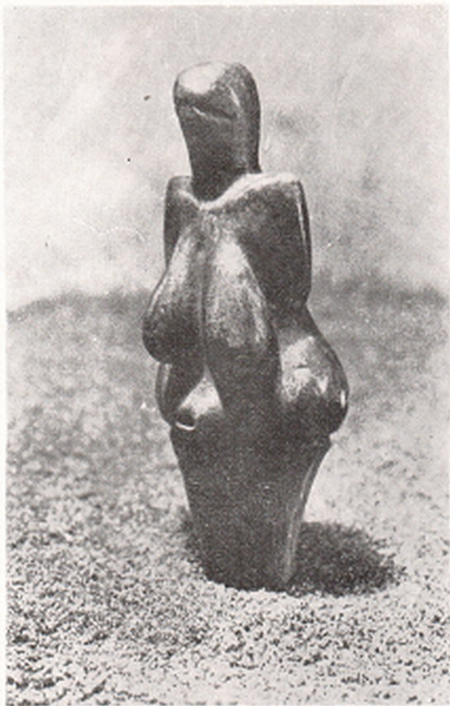
Res. 9. Orinyalıyen kadın heykeli Dolni Vestonice (Moravya - Çekoslavakya)