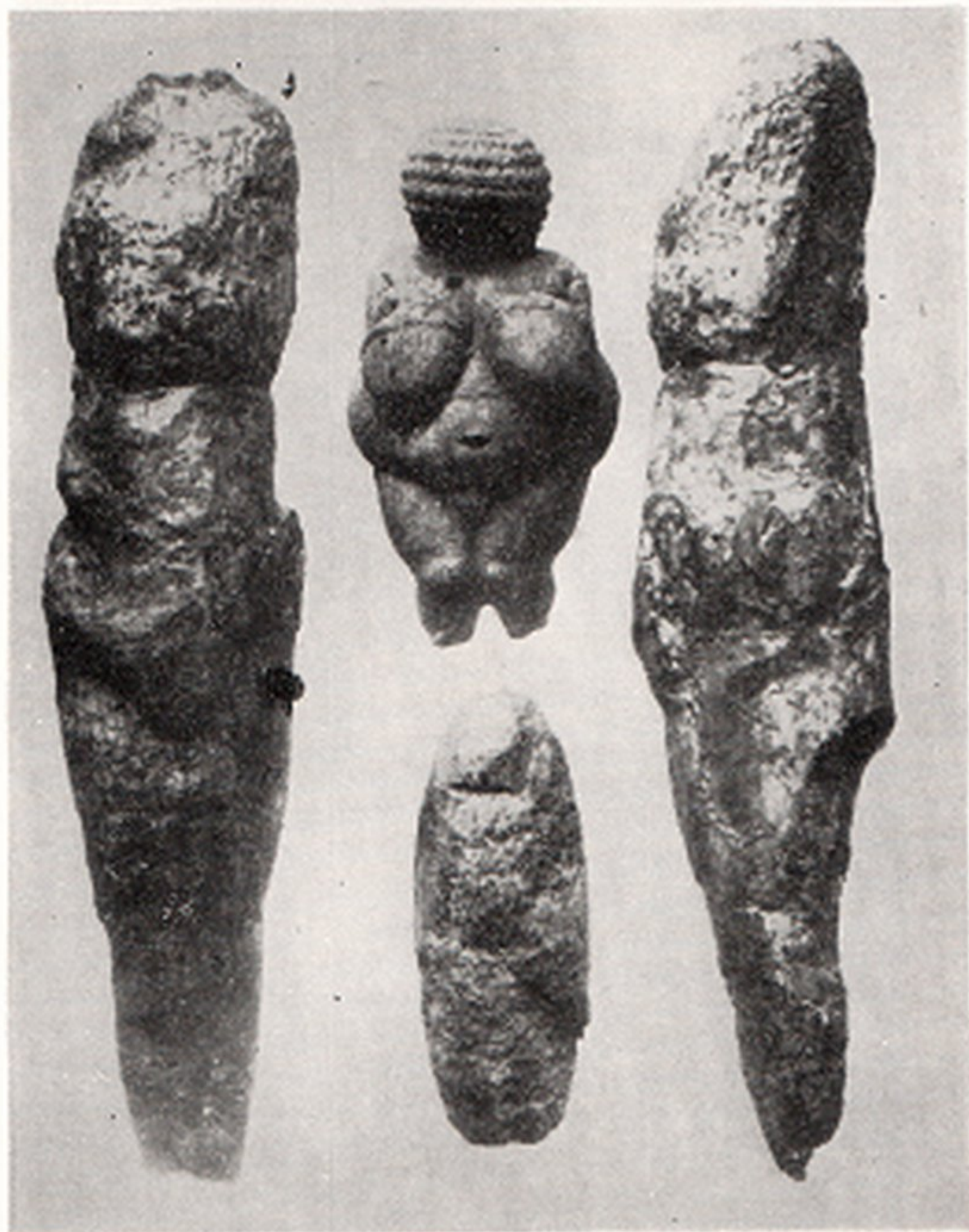
Res. 7a- I ci ve II. Willendorf venedilerinin karşılaştırmalı resimleri (Avusturya)