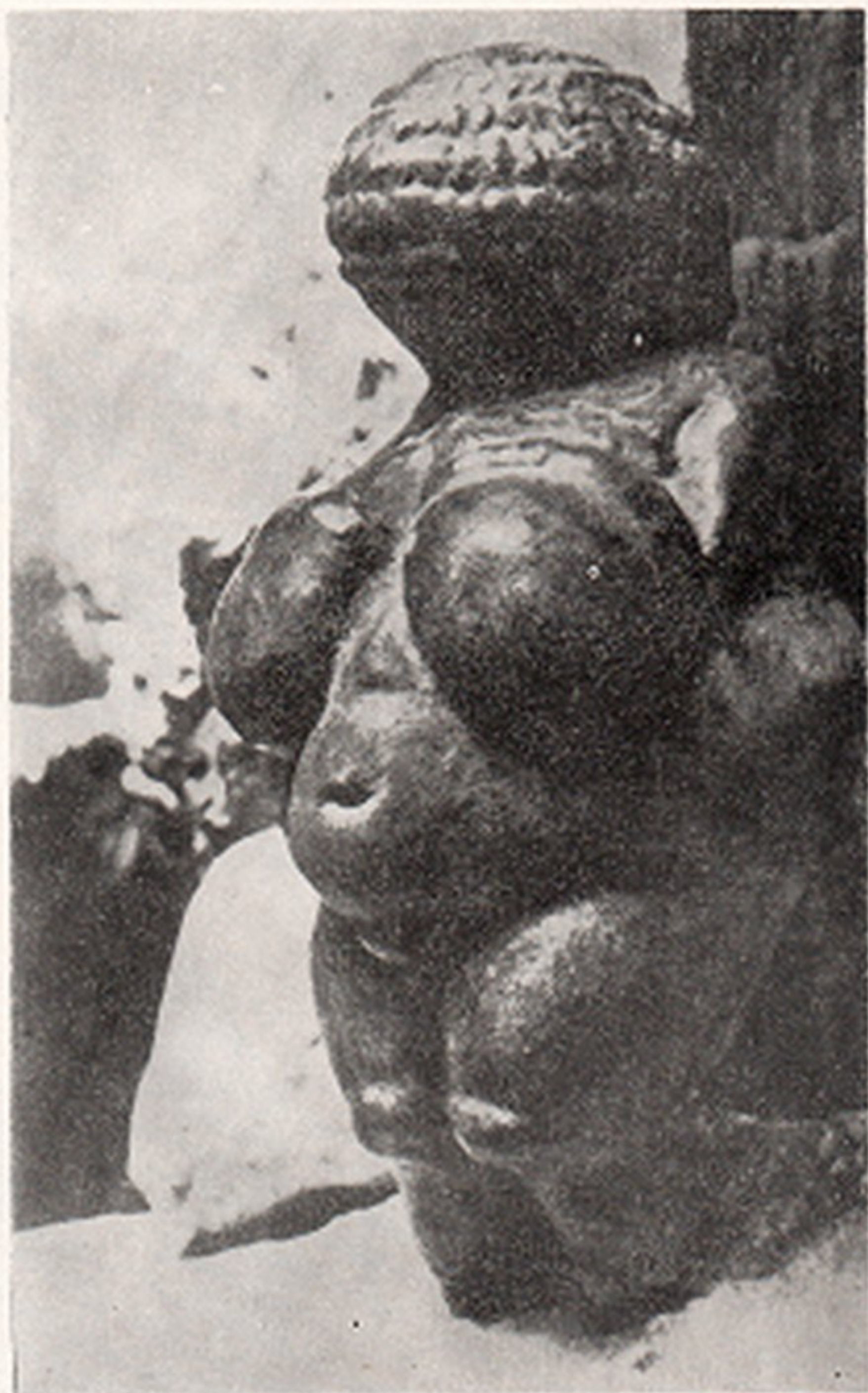
Res.2- Willendorf Vennisi (Aşağı Avusturya)