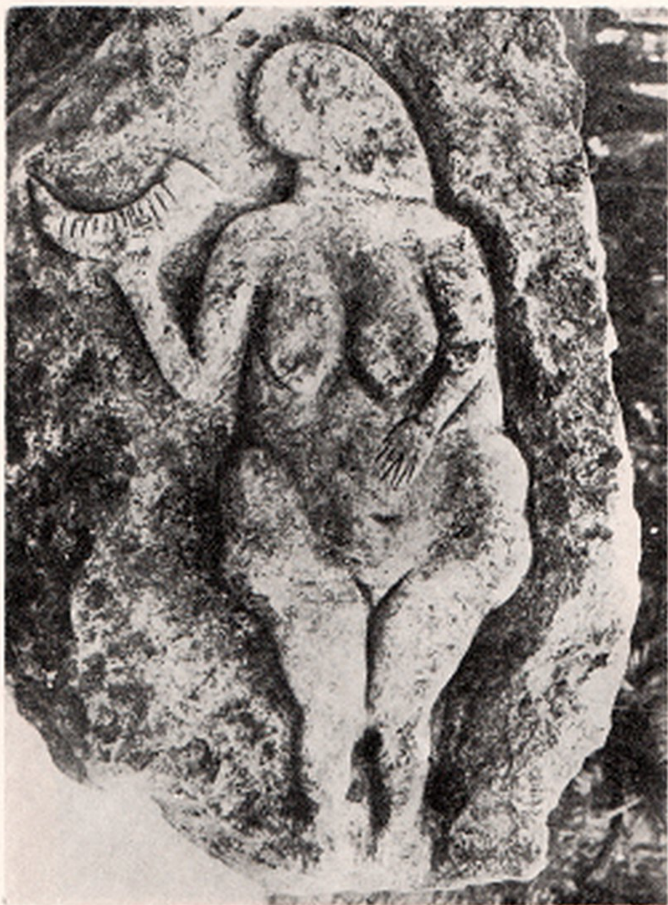
Res. 1- "Elli Boyunda Kadın" alçak kabartması. Lauscel (Lardev, Fransa) kayauğması