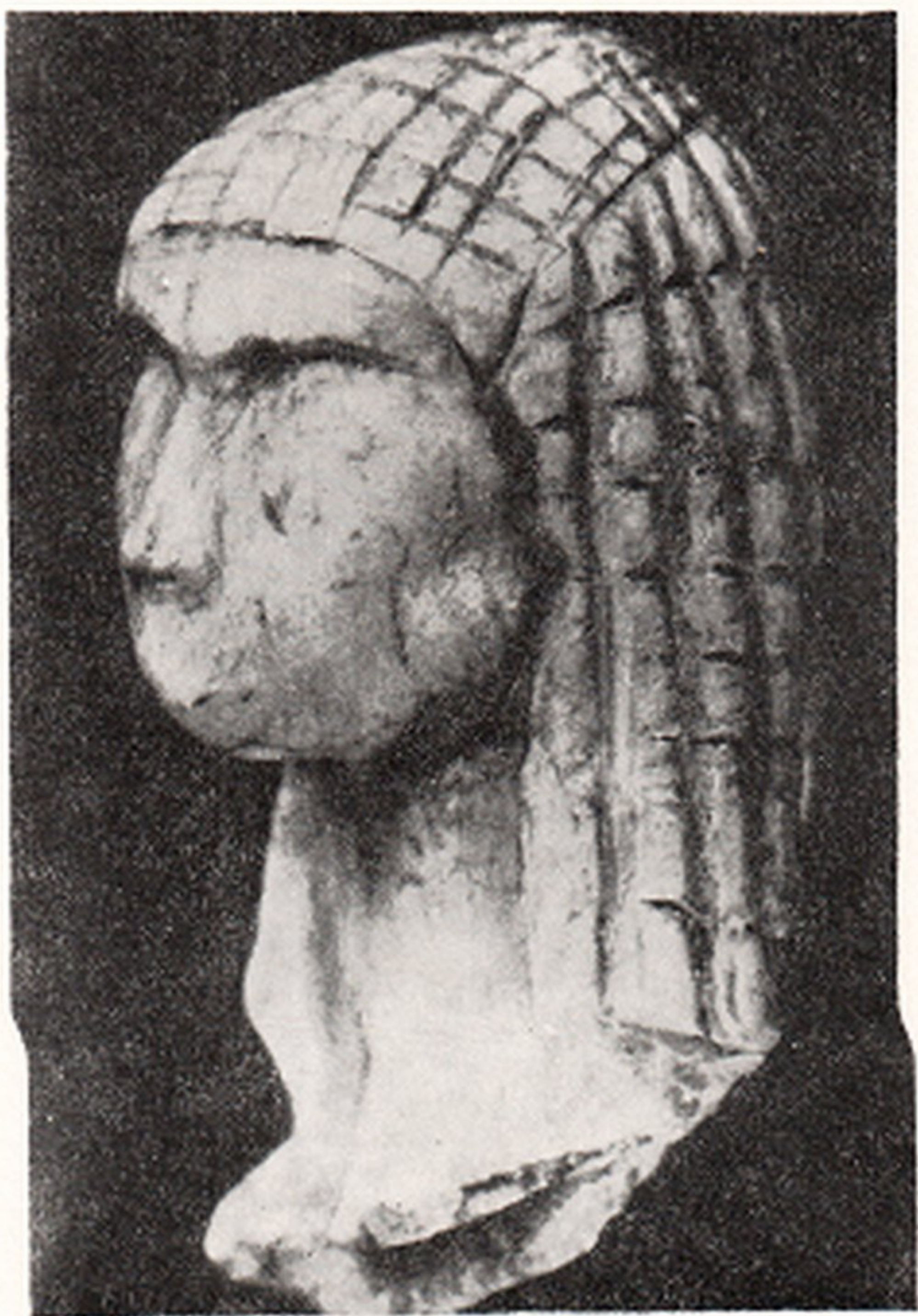
Res. 4- Braxempoury kadın başı heykeliği Braxempoury (Landes, Fransa)