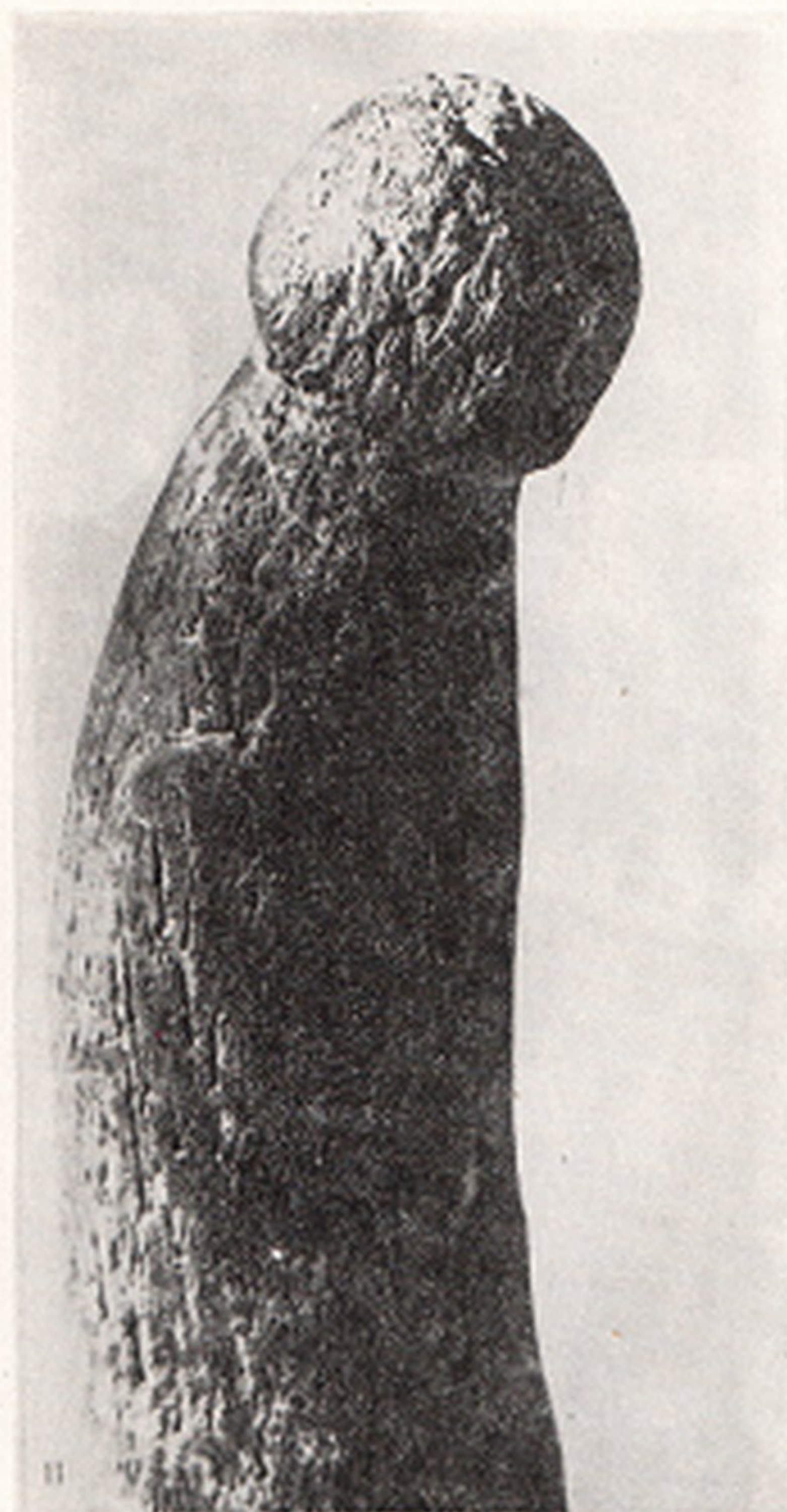
Res. 5- Bizca boynuzundan sülize insan figürünü (Sergiac, Dordogne, Fransa)