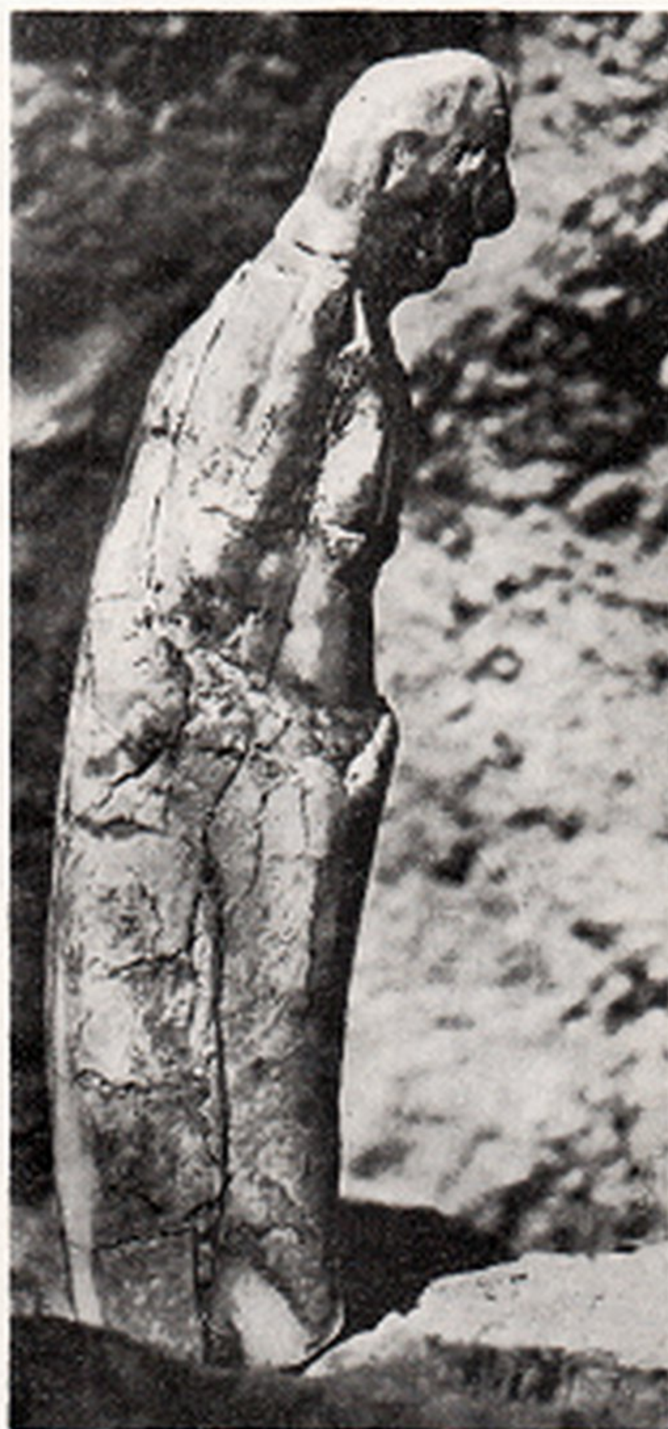
Res. 6- Kadın heykeliği, Atdışine oyulmuş. Boy 55 mm. Magdalanıyen Mas d' Azil (Ariège) Fransa