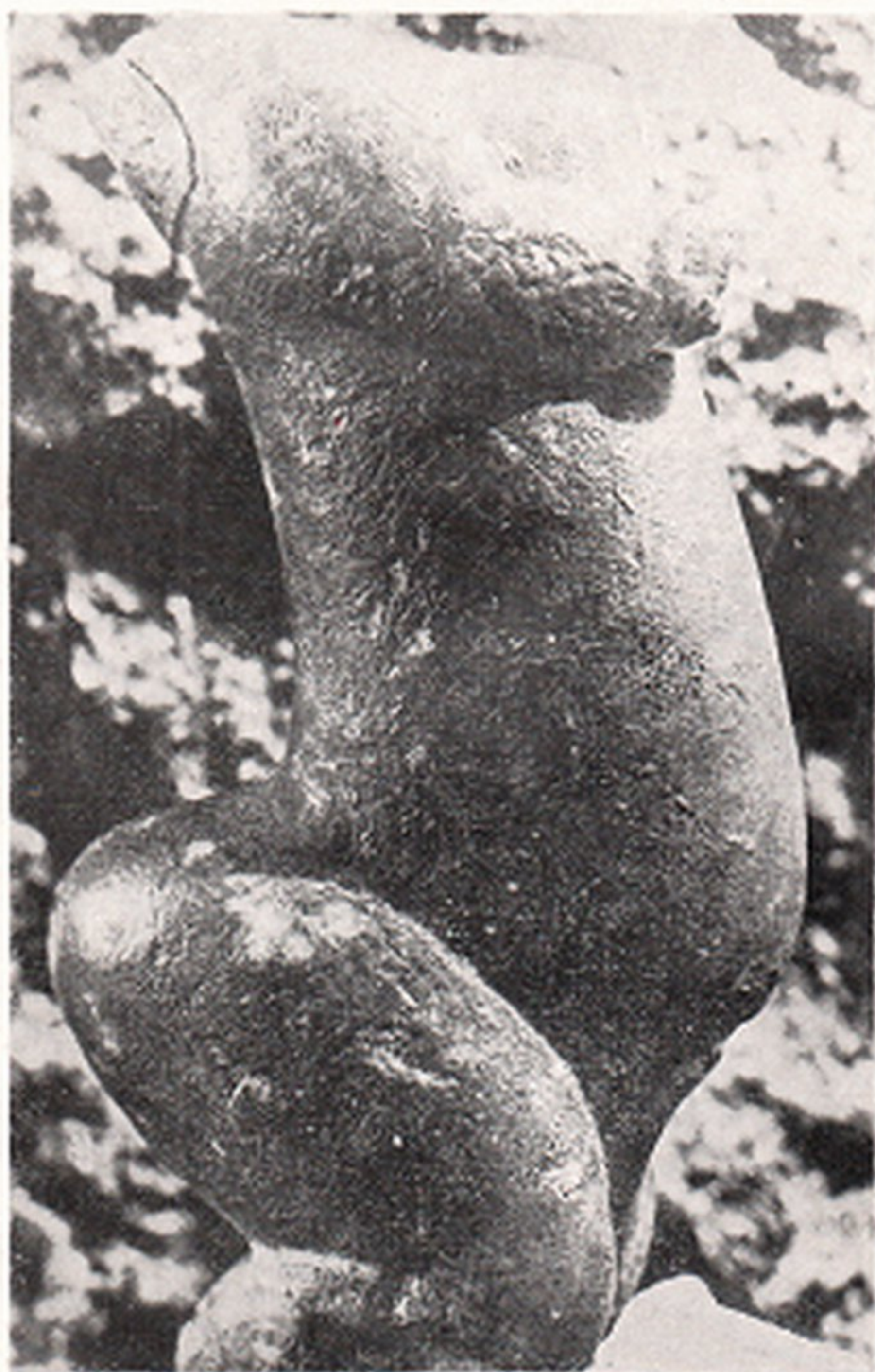
Res. 11- Kalıtın Sireuil Venüsü Goulet de Cazelle. (Sireuil, Dordogne Fransa)