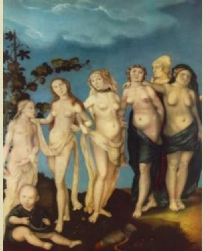
'The seven ages of women' Hans Baldung Grien 1544