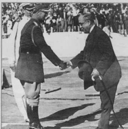
Ο Ιωάννης Μεταξάς εντολοδόχος του Γεωργίου

Ο Αχμέτ Ζώγου, βασιλιάς της Αλβανίας καταφεύγει στην Ελλάδα μετά την Ιταλική εισβολή.