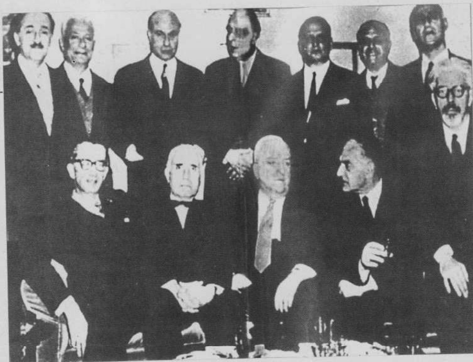
Η "γενιά του '30". Από αριστερά όρθιοι: Θαν. Πετσάλης, Ηλ. Βενέζης, Οδ. Ελύτης, Γ. Σεφέρης, Αν. Καραντώνης, Στ. Ξεφλούδας, Γ. Θεοτοκάς. Καθισμένοι: Άγγ. Τερζάκης, Κ. Θ. Δημαράς, Γ. Κατσιμπα- λης, Κ. Πολίτης, Αν. Εμπειρικός

Ο Στέφανος Δημητρίου , με αφετηρία το περιοδικό "Ιδέα" του Σπύρου Μελά και τους "Νέους Πρωτοπόρους" της Αριστεράς, αναφέρεται στα περιοδικά της εποχής. Ο Γιώργος Καρμπελιάς επιμένει στη σχέση μεταξύ γενιάς του '30 και "γενιάς του '60" και "συγκρίνει" την "επιστροφή" στον Μακρυγιάννη με το διάβημα της "νεοορθοδοξίας", ενώ ο Δημήτρης Πουλάκος καταγράφει τάσεις και ρεύματα στο εσωτερικό της γενιάς του '30, καταγραφή που εν μέρει προέρχεται και από την προσωπική επαφή του με αυτήν.