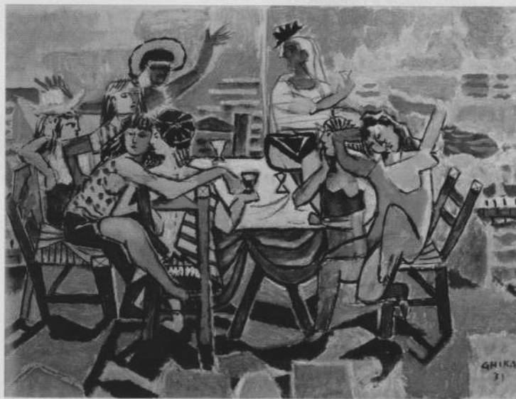
N. Χατζηκυριάκος Γκίκας, "Γλέντι στην ακρογιαλιά". 1931

α του, τους τραγικούς γύψους της κáμαράς του, αλλά ο καρυωτακικός ποιητής κλείστηκε μέσα στη κáμαρά του, και κάποτε μάλιστα μέσα στο