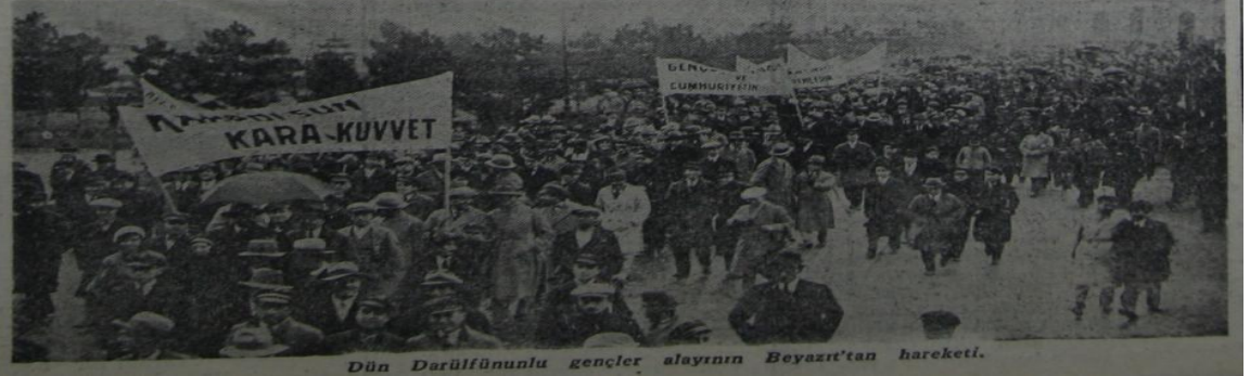
Dün Darülfünunu gençler alayının Beyazıt'tan hareketi.

Büyük Erkânharbiye Reisi Müşür Fevzi Pş. Menemen hâdisesi dolayısıyla bazı makamattan, vilayetlerden belediye lerden ve Türk ocaklarından ve sair te- (Devamı 4 üncü sayfada)