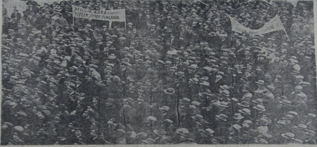
Genliğin İstanbul Darülfünunu meydanında istisna karşı mitingi

İcra Vekilleri Heyeti dünkü içtima- ında örfî idare ilanı hakkında şu karar- nameler istar olunmuştur: