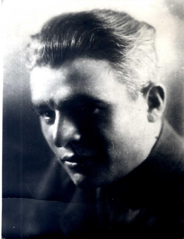
Şehit Asteğmen Mustafa Fehmi Kubilay