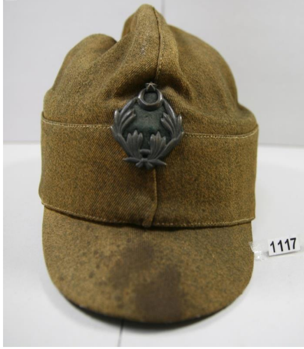
Şehit Asteğmen Mustafa Fehmi Kubilay'ın Şapkası, Türk İnkılap Tarihi Enstitüsü Arşivi , Müze Evanter No: 1177.