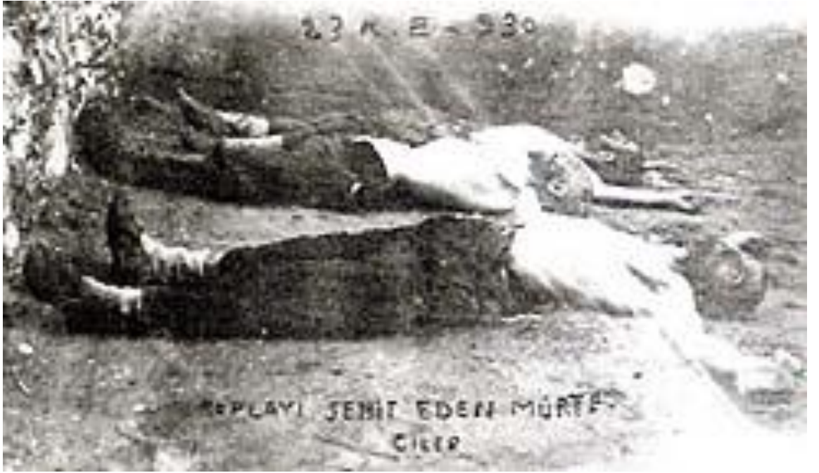
23 Aralık 1930’da güvenlik güçleri ile girdikleri çatışmada ölen asiler