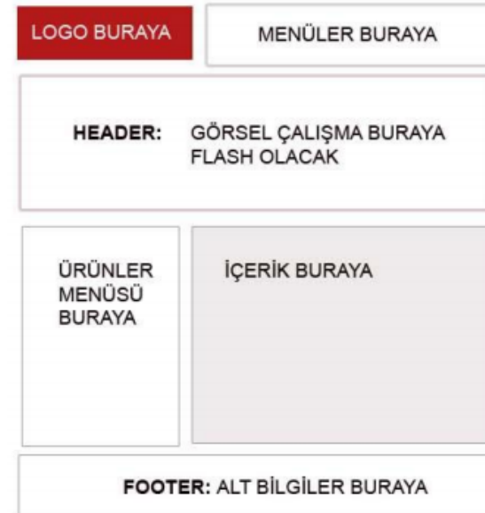
Şekil 1.2: Bilgisayar ortamında tasarım çalışması