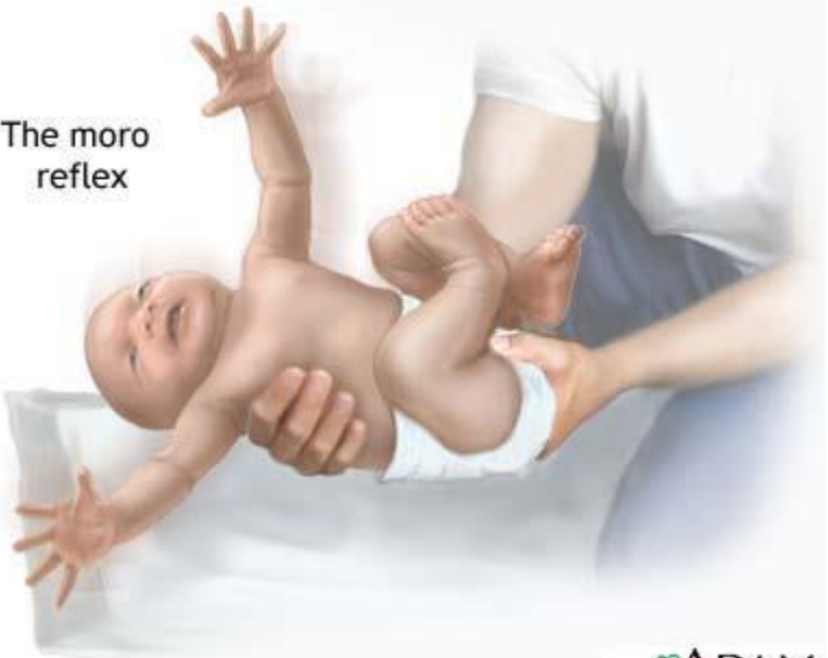
The moro reflex