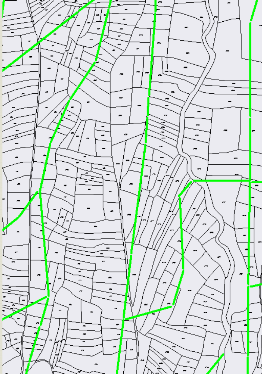
Toplulaştırmazsız parselasyon ve kanal güzergahı