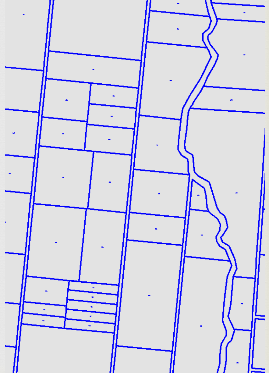
Toplulaştırmalı parselasyon ve kanal güzergahı