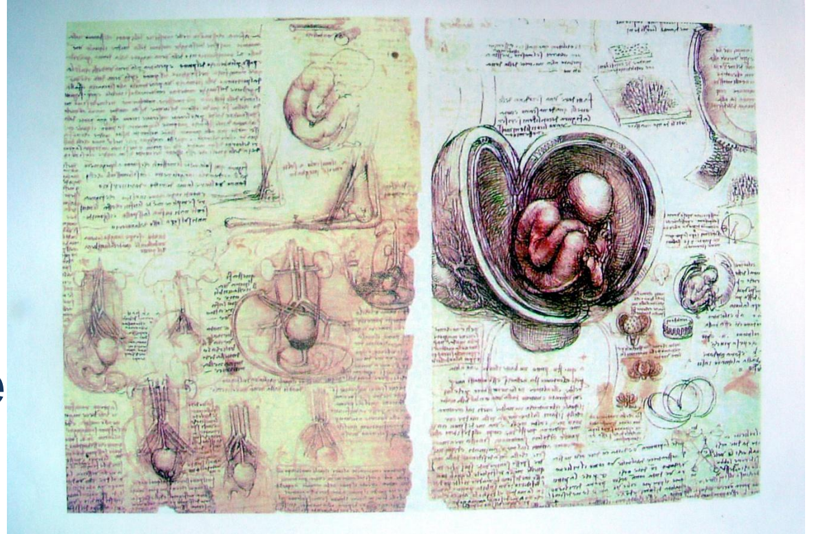
Leonardo Da Vinci Drawing Fötüs into Uterio, 15.yy.

Hipokrat'ın bazı doğumlara yardım ettiği bu nedenle de ona "erkek babaanne" dendiği bilinmektedir .