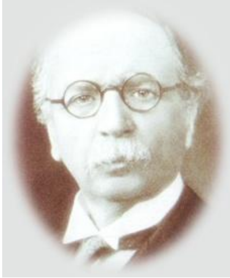
Besim Ömer Paşa