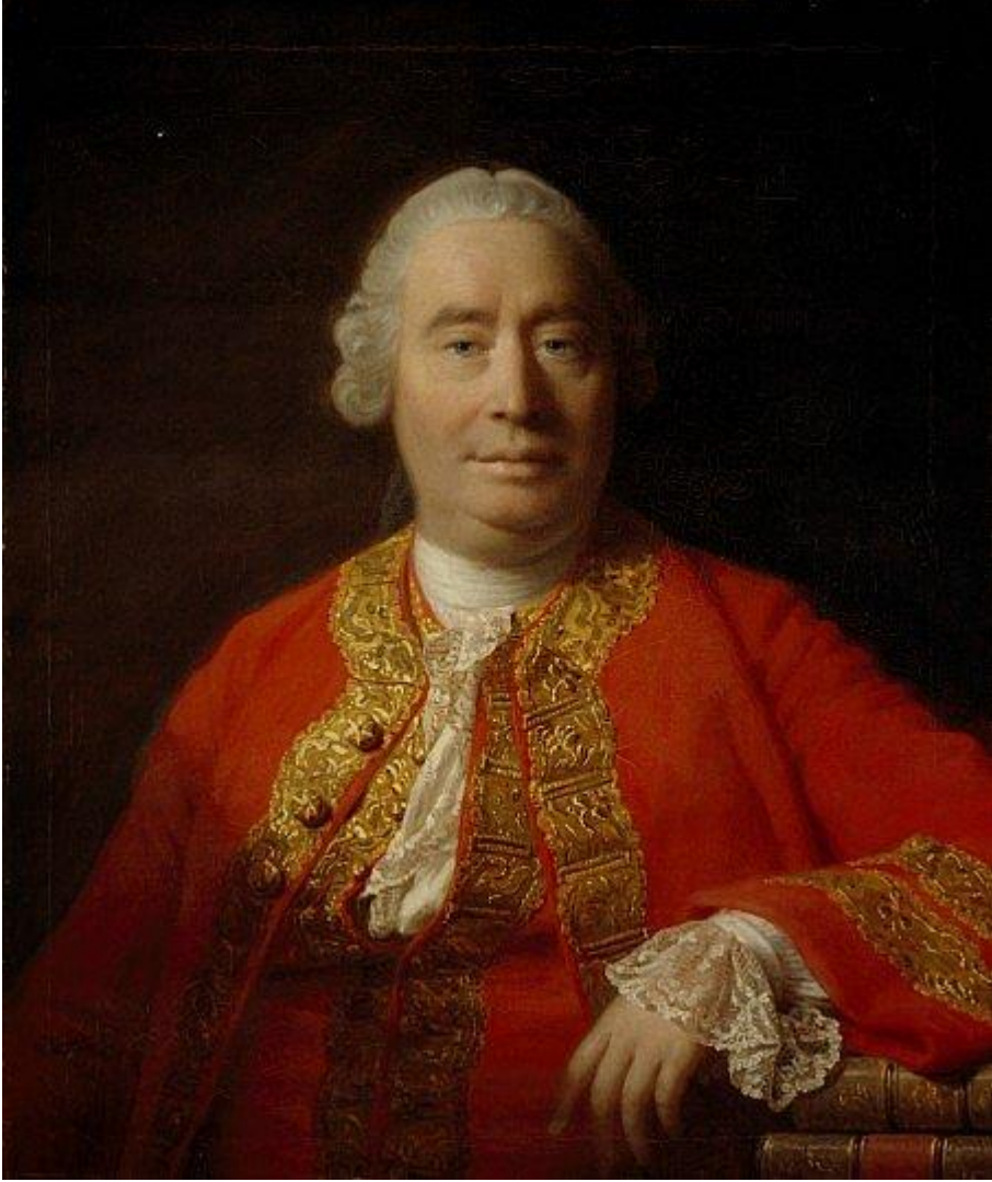
Allan Ramsay, David Hume'un portresi, 1766

Örneğin Allan Ramsay'ın yaptığı David Hume portresine neşeli dediğimde ne anlaşılır?