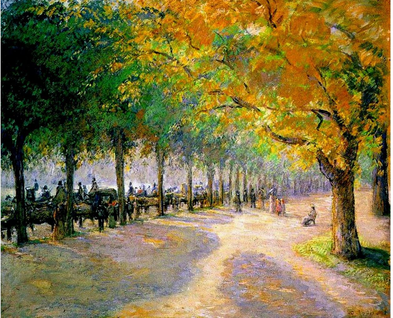
Camille Pissaro, Hyde Park

“Pissaro’nun bu resmi dengeli ve ışık doludur.” ?