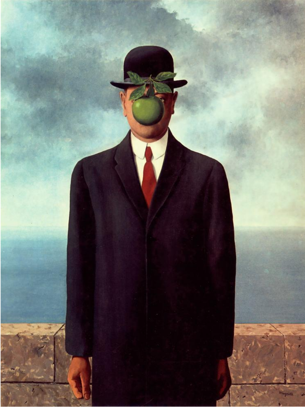
Rene Magritte, The Son of Man