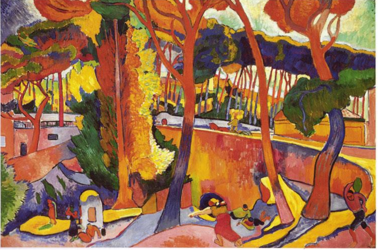
Andre Derain, The Turning Road, L'Estaque

“Derain’ın bu resmi, enerjik, yaşam dolu ve vurguldur.” ?