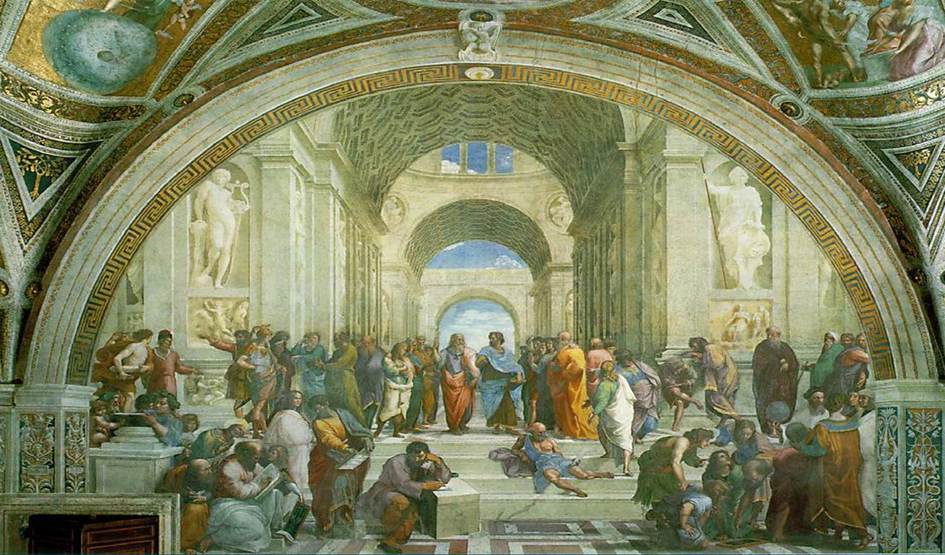
Raphaello -Atinalılar'ın Okulu-1509