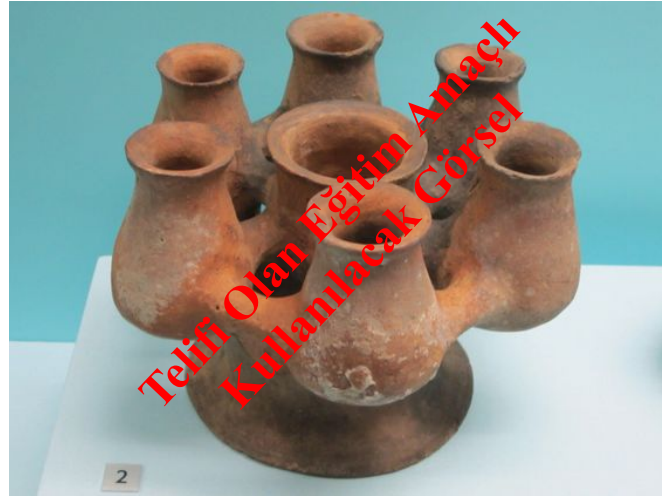
Kernos kaynak https://www.pinterest.co.uk/pin/403283341624565300/