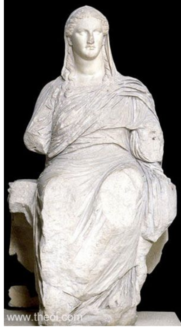
Knidoslu Demeter, Britanya Müzesi, MÖ 350 yılları