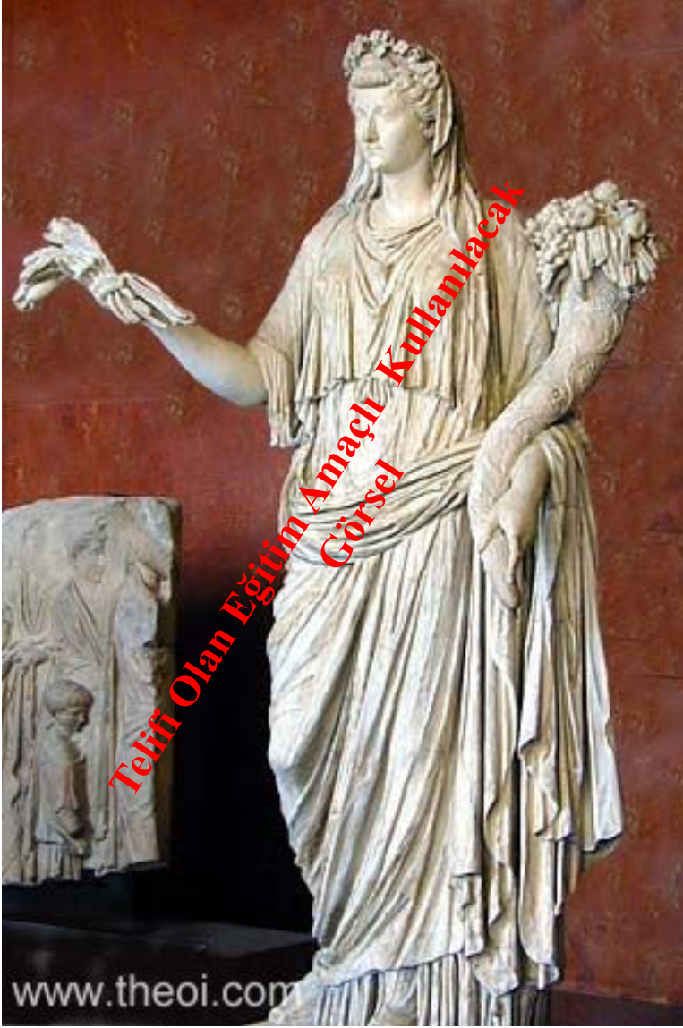
St. Petersburg Hermitage Müzesi Ceres-Demeter Roma Dönemi