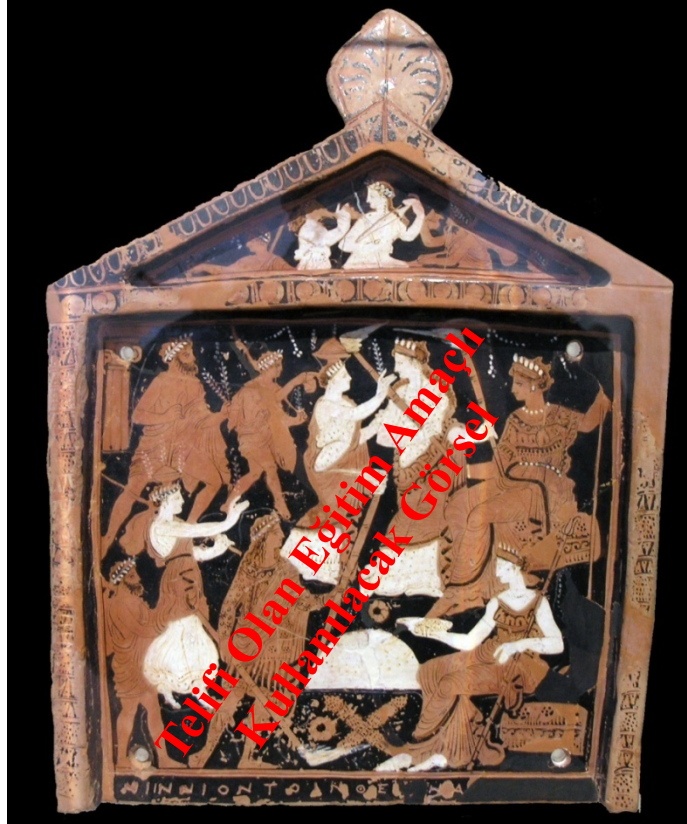
P.T. Pinax, Eleusis'te Demeter, Persephone Mysterler kültü sahnesi Atina Müzesi MÖ 4. yy

Kernos: Pişmiş topraktan bir tür sunu vazosudur. Bronz Çağı'ndan Kyklad adaları ve sonrasında Yunanistan'daki kentlerde gizemli ayinlerde kullanılan kernos birbirine bağlı kadehlerden oluşmaktadır. Platon'un liknon (tahıl sepeti, beşik) kelimesi ile tanımladığı bu kap için iki farklı tasvir vardır. İlkinе göre kernos Eleusis ayinlerinde kullanılan p.t. Kaptır. İkincisine göre mistik amaçlı bir krater türüdür. Eleusis'te kernos taşıyan rahibelere kernos taşıyıcı anlamında kernophoros adı verilmiştir.