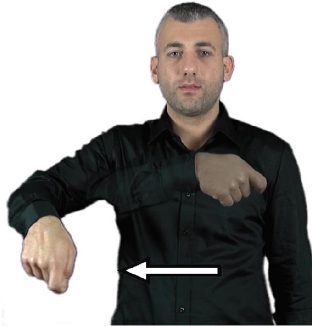
MAAŞ (tek elle)