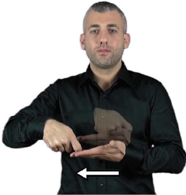
MAAŞ (çift elle)