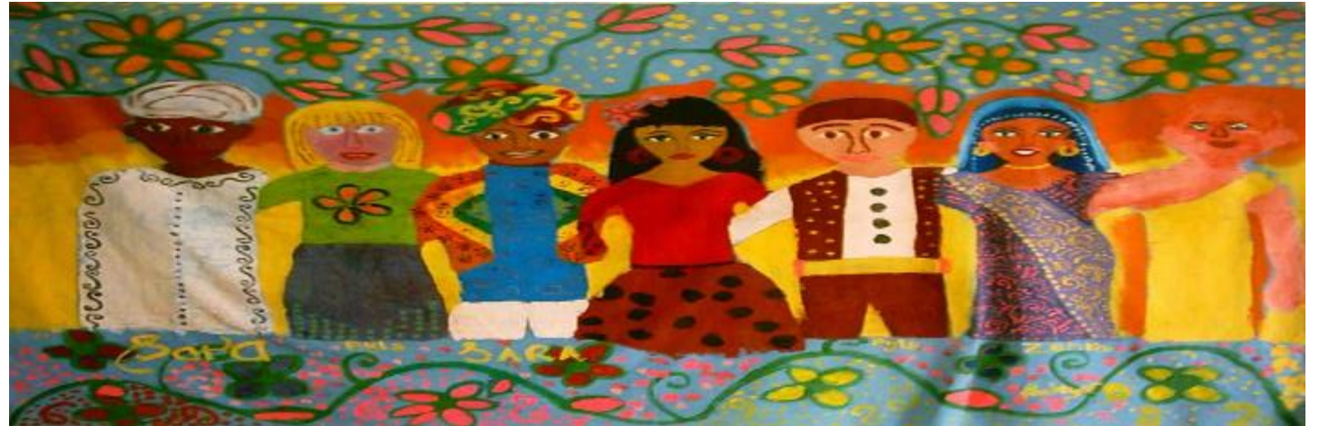
Çokkültürlülük Ders Notu

Din , toplumların gelişmişlik düzeyine göre farklı düzeyde etkiler üretmekte ve toplumsal yapının temel rolleriyle bağıntılı yaşamı dizayn edebilmektedir. Toplumsal yaşama içkin bu tür dizayn ve normlar, din eksenli olabileceği gibi, toplumsal üretimlerle dinlere mal edilen üretimler de olabilmektedir. Dolayısıyla, din ve toplum arasında, çeşitli ölçek ve düzeyde karşılıklı etkilenmeler oluşmakta ve toplumsal hayatı inşa eden temel unsurlar olarak yer edinebilmektedirler... Örneğin, dinlerin toplumsal düzeyde ürettiği 'dil' , 'kültürel norm' , 'psikolojik etki' , 'sanatsal etki' ve elbette ki sosyal bilim olarak beşeri coğrafya disiplini için de büyük önem kazanmaktadır (Özgen, 2018: 126).