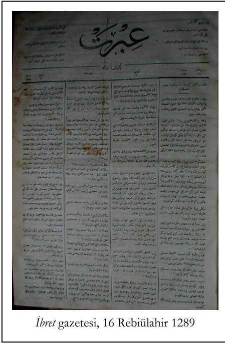
İbret gazetesini, 16 Rebiülahir 1289

İbret yazarlarının halkın refahı ile bağlantı olarak ele aldığı konular arasında ticaret ve zanaat da bulunmaktaydı. Bilindiği üzere, 19. yüzyıl boyunca ve giderek artan bir biçimde, bazı grup ve bireyler iltizamların elde edilmesi için uğraşmış, küresel ticaret ve bankacılık alanlarında yatırımlar yaparak servetlerini arttırma ve korumanın yeni yollarını aramışlardır. Bu gruplar arasında yabancı girişimciler ve bunların Osmanlı toplumdaki ortakları gibi birçok Osmanlı yatırımcısı da bulunmaktaydı. Bu tür servet arttırmaya yönelik çabalar Osmanlı toplumunda emperyalist politikaların uzantısı ve uygulayıcıları olarak algılanan uluslararası girişimciler, bunların Osmanlı toplumdaki ortakları ve Osmanlı çıkarları arasında zaten var olan çekişmeyi daha da görünür kılmıştır.